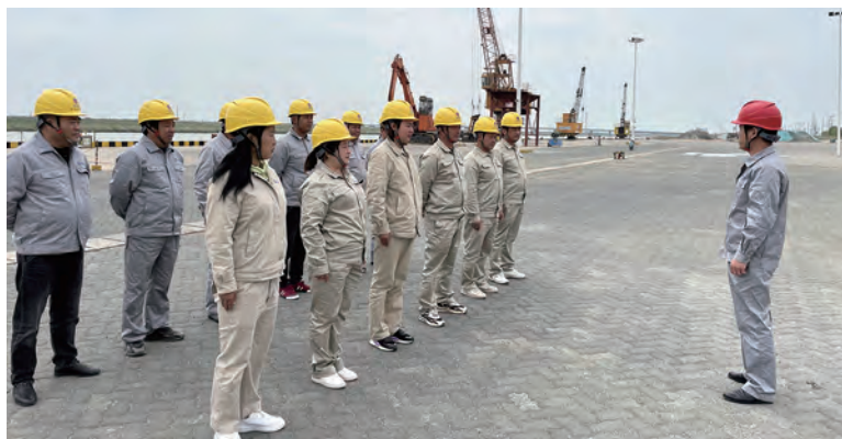
为进一步提高职工消防安全意识,加强仓储物流场所消防安全管理,确保辖区消防安全形势持续稳定。近日,灌西青洋物流公司对接燕尾临港消防支队,开展消防安全宣传教育培训、实战应急演练。有效提高员工自防自救能力。(许东彦 胡秀同)