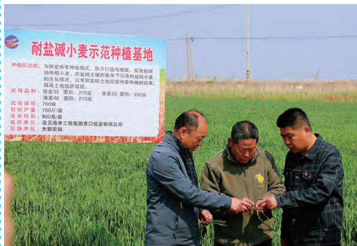
近日,青口大新农场组织技术人员深入田头查看小麦长势,紧跟农时抓好耐盐碱小麦生产管理,为小麦稳产打好坚实基础。(顾益 王璐)