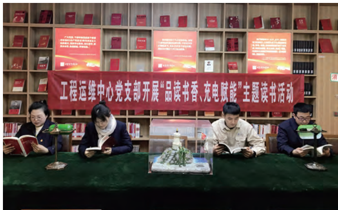
为进一步营造“在工作中学习,在学习中工作”的浓厚氛围,日前,供电工程分公司工程运维中心党支部在连云港市图书馆开展了“品读书香、充电赋能”的主题读书活动。(王梦洁)

注入橙色暖流,氛围更加和谐。在职工谈心谈话、集体协商、信访维稳等工作中,党小组侧重意识形态、党建引领,工会小组侧重发挥监督协调、维护纽带作用,生产班组立足安全生产、民生诉求,积极构建和谐劳动关系;通过党员与职工“1+1”志愿结对、工会“暖心工程”等活动,形成扎实的帮扶救助机制;开展“我们的节日”系列文体活动,营造和谐稳定的发展氛围。(金宣)