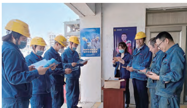
连日来,利海化工公司紧紧围绕“改善工作环境和条件·保护劳动者身心健康”宣传主题,开展了一系列职业病防治知识宣传活动,进一步普及职业病防治知识,增强职工职业病健康意识,营造了关心、关注职业病防治的浓厚氛围。(王静静 刘欣)

▲近日,供电工程分公司徐南供电所通过方案策划、过程监督控制、用地保护检查等方式,积极推进连云港田湾核电500千伏送出加强工程建设。(周国成)