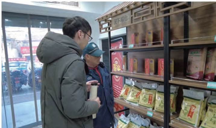
近日,“盐田玉”新米上市的消息,吸引许多新老顾客纷纷前往巨龙路门店进行购买,并且对大米的口感与香味赞不绝口。(耿丽园)

借力技能实训基地,依托各业生产现场设施设备常态化开展技术练兵活动,推进“一星三制”产改机制进班组,保障职业发展通道“线”贯通,让产业工人事业上更有成就感。通过开展“班长轮值”“安全员轮值”活动,通过设置委员包片区、党员责任区、党员示范岗、最美班组长、最美产业工人等荣誉,进行角色体验、换位思考,进一步强化综合技能,有力推动了各行业重点工作,为全年丰产丰收、提质增效打下了坚实基础。(西宣)