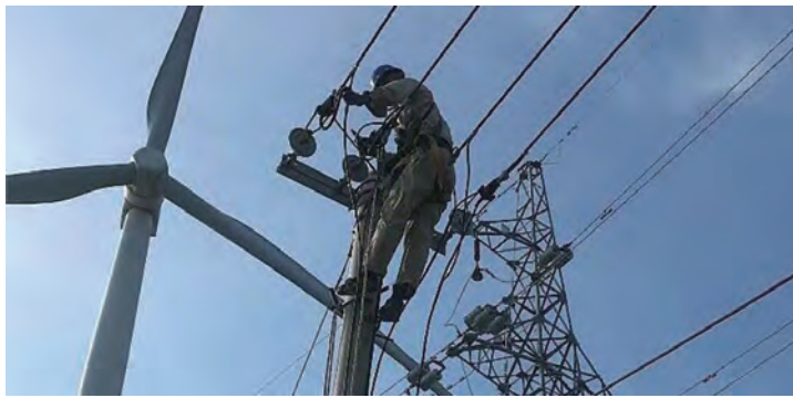
为确保如期完成工程项目建设目标,在迁改项目现场,供电工程分公司灌西供电所切实发挥“稳定器”和“压舱石”作用,抢工期、抓进度,全力保障重点项目建设用电,为区域经济发展注入坚强后劲。(周广余)