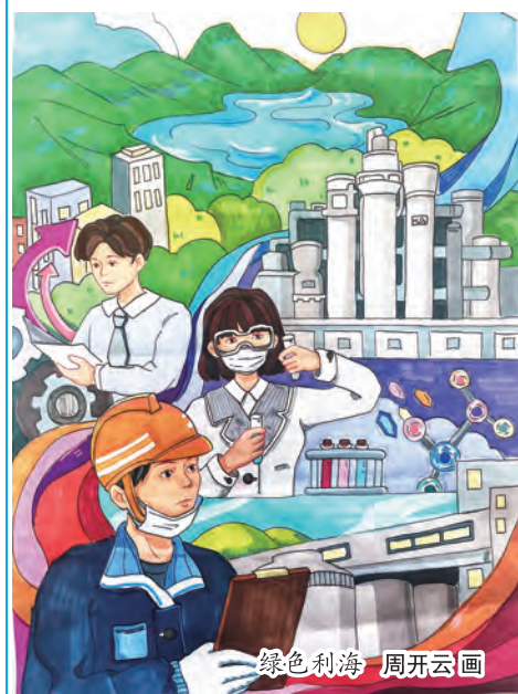
绿色利海 周开云画